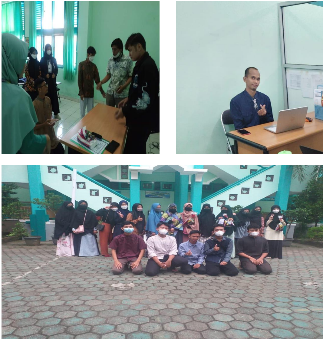
Gambar 1. Kegiatan Pengabdian