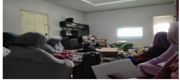
Gambar 2. Diskusi dan Post test