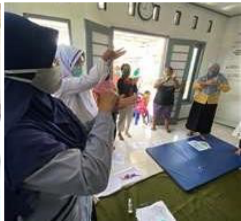
Gambar 3. Praktek Cuci Tangan