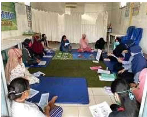
Gambar 2. Pemberian Materi