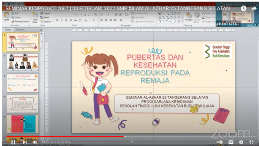
Gambar 3 Pemaparan Materi Tentang Kesehatan Reproduksi

Gambar 2 menjelaskan tentang perolehan nilai yang didapatkan sebelum pemaparan materi. Terdapat 37 siswa/ siswi yang mengikuti namun tidak semua peserta mengikuti hingga selesai, hal ini dimungkinkan karena kendala jaringan.