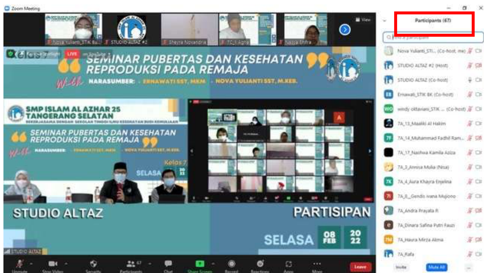
Gambar 1 Pembukaan oleh SMP Islam Al – Azhar 25

Pada pretest rata – rata ketepatan menjawab soal sebesar 88% dan jumlah soal menjawab benar 13 soal (86%). Pada Posttest rata – rata ketepatan menjawab soal sebesar 91% dan jumlah soal menjawab benar 14 soal (93%).