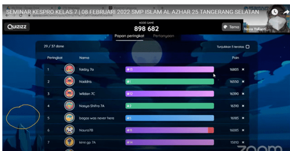
Gambar 2 Nilai Pretest Sebelum Pemaparan Materi

Gambar 1 merupakan kegiatan pembukaan oleh master of Ceremony siswa dari SMP Islam Al-Azhar 25 dilanjutkan dengan rangkaian kegiatan pembacaan kalam ilahi, ikrar, menyanyikan lagu Indonesia Raya dan Mars Al – Ahar serta sambutan – sambutan. Terlihat pada gambar jumlah partisipan sebanyak 67 peserta. Terdiri dari siswa/ siswi, guru, panitia kegiatan dan TIM pengabdian masyarakat STIK Budi Kemuliaan.